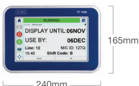
CONTRÔLEUR VUE DE FACE