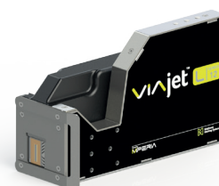
VIAjet™ L-Series L12-printkop