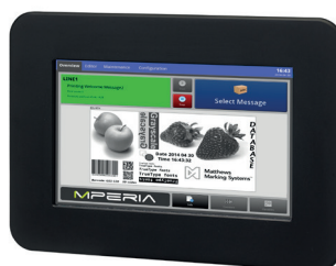
MPERIA™ Standard HE

Aangezien Matthews Marking Systems voortdurend verbeteringen doorvoert aan zijn producten, behoudt het bedrijf het recht voor om het design en/of de specificaties zonder voorafgaande kennisgeving te wijzigen. © 2014 Matthews Marking Products